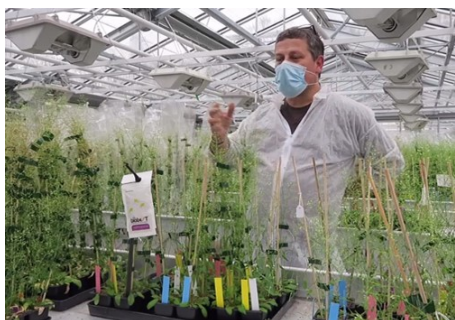
M.J. Sellier (Copyright © Saclay Plant Sciences)

En raison du contexte sanitaire actuel, l'association Ile-de-Science Paris-Saclay a décidé, de nouveau cette année, de vous inviter à visiter son Village des Sciences en mode « virtuel » ; des vidéos en ligne vous permettront de parcourir les stands, de naviguer au gré des ateliers, et de découvrir les dernières avancées scientifiques à travers des outils numériques.